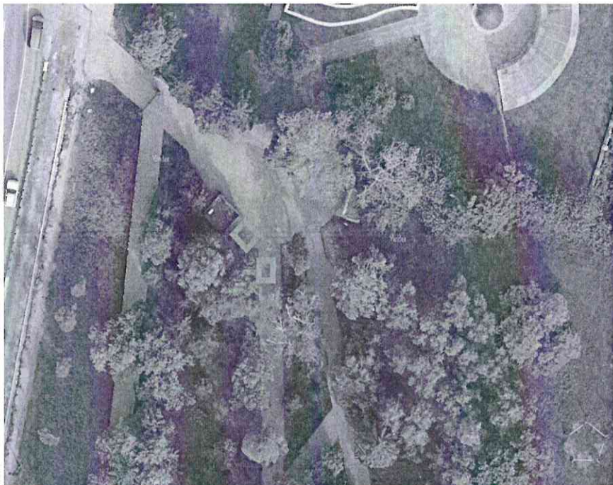
Схема размещения торговых мест на Ярмарке «День города» Сад Ермака