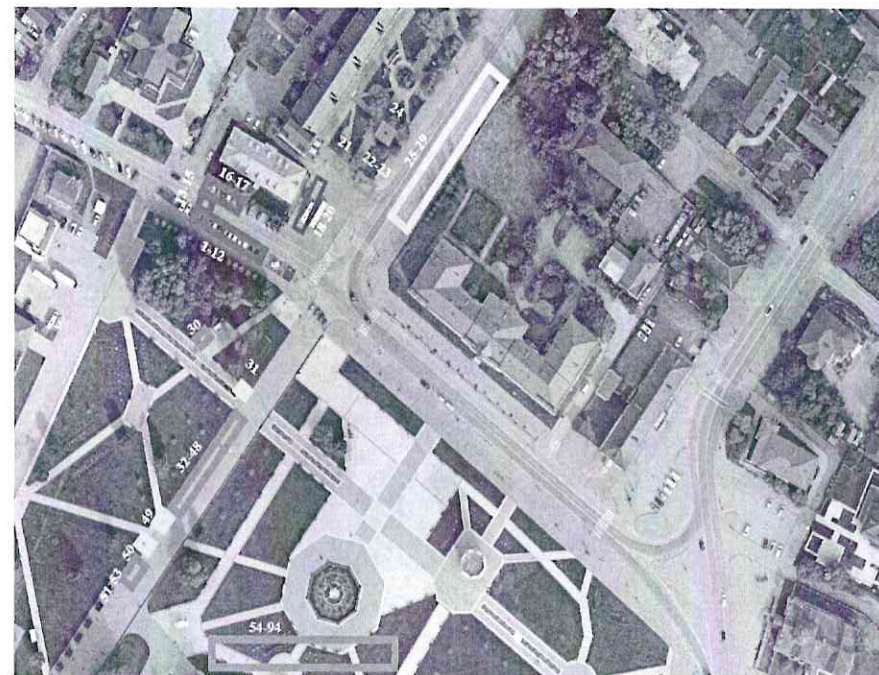
Схема размещения торговых мест на Ярмарке «День города» Красная площадь; пер. Свердловский, в районе участка 7; Сквер Ершова

общественное питание торговля фудтрак прокат, аквагрим